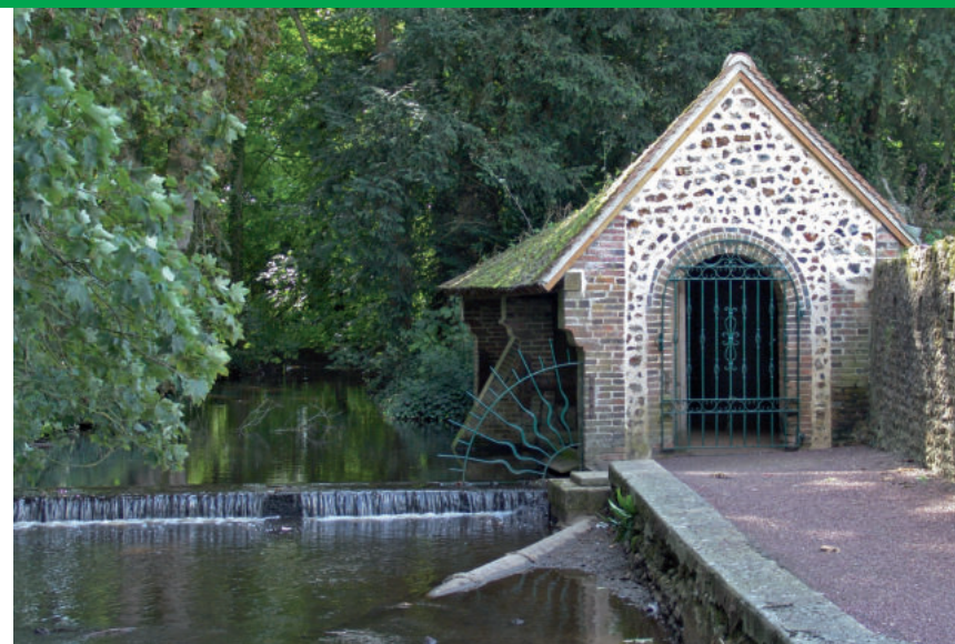
Le lavoir communal restauré

Dans le hameau du « Haut Chesnet » tourner à droite et poursuivre par un chemin de terre (vue sur la ville de Randonnai et la vallée de « l'Avre ») près d'un château d'eau. Au carrefour avec une route bitumée, tourner à gauche et suivre la route sur 800 m. À l'intersection suivante avec un chemin empierré, juste avant une balise de priorité, tourner à droite et suivre cette piste sur 1,2 km. Traverser dans l'axe avec prudence la départementale 918 et poursuivre par la route goudronnée en face vers « la Touche ». Dans le hameau, tourner à gauche après un poteau électrique puis suivre le chemin en herbe. Au carrefour d'une route goudronnée, traverser dans l'axe. (On laisse sur la gauche un monticule couvert d'un bosquet, restes d'une ancienne motte féodale à « Chauvigny »). Au carrefour suivant, intersection de circuits laisser en face l'accès à une ferme et tourner à droite sur le chemin