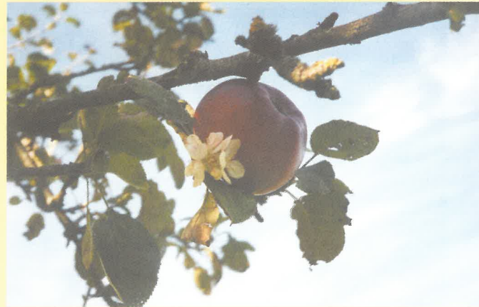
Pomme en fleur

Suivre la petite route qui monte vers "La Croix Chartel". Au niveau de la croix, descendre à droite, un chemin de terre vers le lieu-dit "La Blanchonnerie". Au croisement des chemins, prendre à gauche jusqu'au "Moulin de Raudou", puis s'engager sur la petite route qui part légèrement sur la gauche en direction du "Buisson de Fay". Sur cette route, prendre le premier chemin à droite, puis tourner à droite à mi-montée vers les étangs. Au lieu-dit "La Choletière", descendre à droite vers "Le Moulin de Raudou", puis bifurquer à gauche deux fois pour retrouver le bourg de Fay.