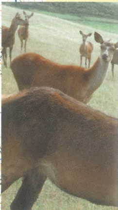
Élevage de ce